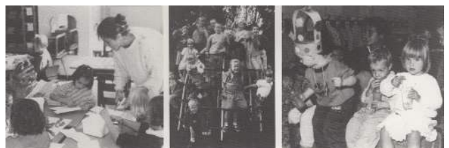
Klasfoto St-Vincentius 1993 : Kleuters