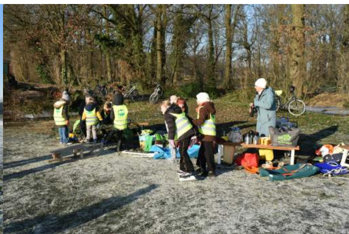
Schaatsplezier op de weide van de Schamhoeve