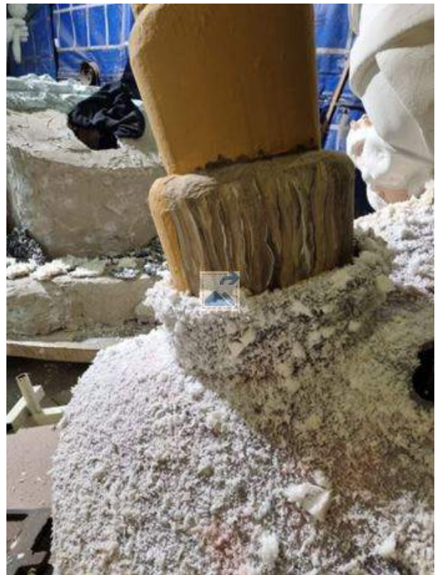
Carnavalswagen in de maak