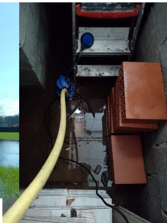
Water, water en nog eens water. Door de vele regen van afgelopen maanden staan de velden er nat bij en hebben veel kelders en verluchtingsruimten last van insijpelend grondwater.