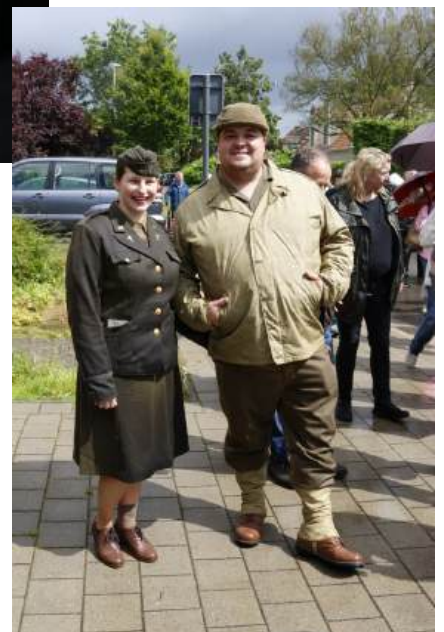
Uitgeremd maar toch nog bij elkaar