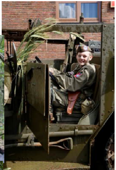
↑ Eén van de jongste deel- nemers