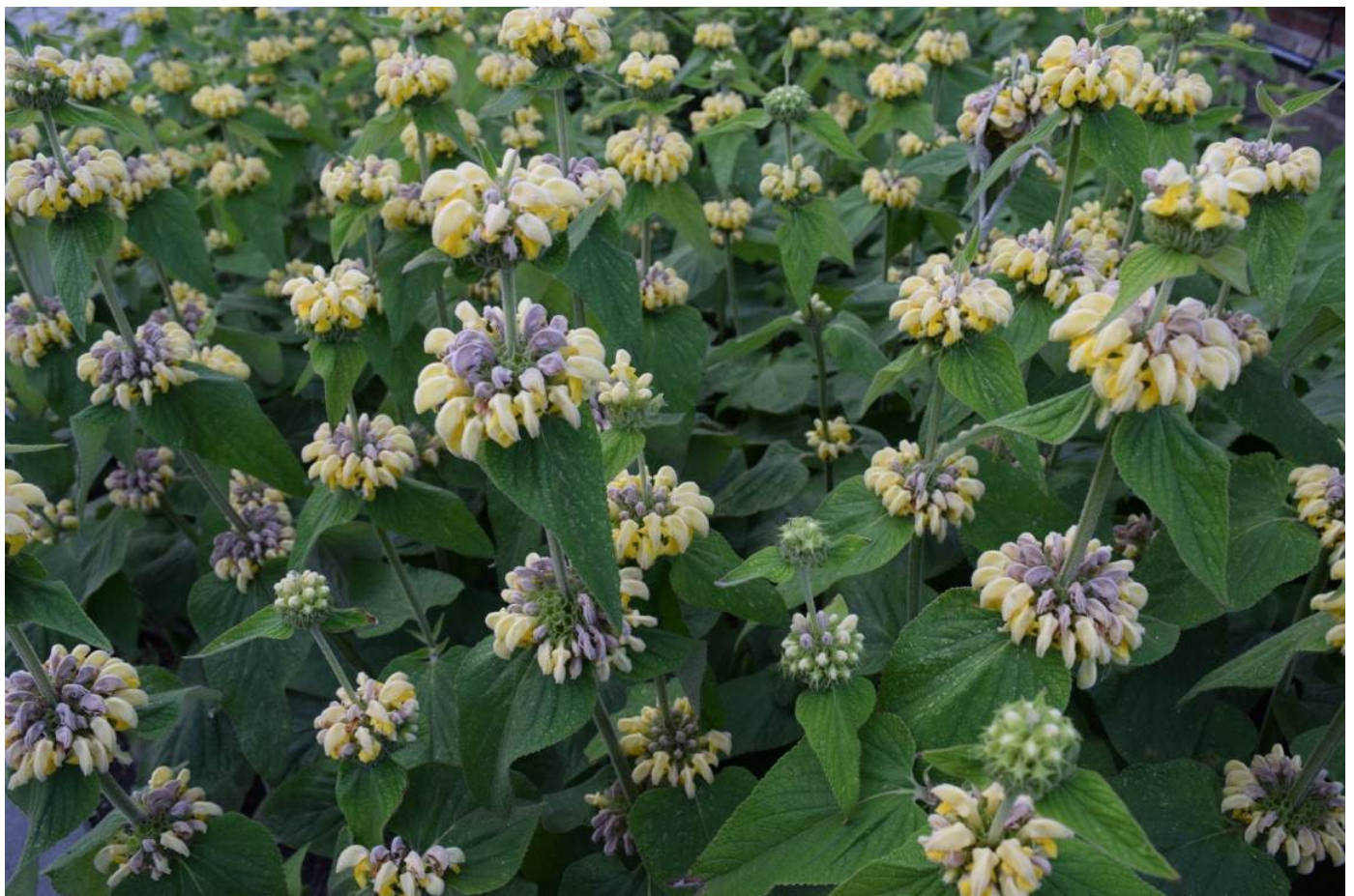
Bloemen aan de kerk van Horendonk PHLOMIS RUSSELIANA (brandkruid of etagebloem)