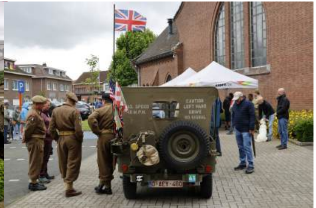
Bijeenkomst op het kerkplein Horendonk

Tijdens de wandeling uitleg over het verloop van de bevrijding →